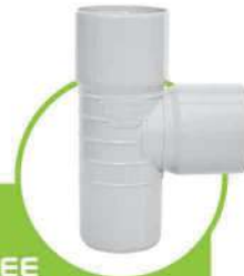
سراهی 90 درجه 90-DEGREE INSPECTION TEE