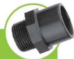
بوشن یکسر مغزی SINGLE-CORE COUPLING