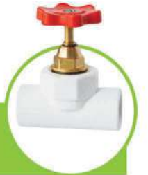
شیر فلکه کامل FULL PORT BALL VALVE