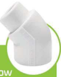
زانو چپقی ۴۵ درجه 45-DEGREE SOCKET ELBOW