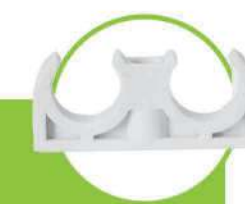
بست زوج لوله PIPE COUPLER