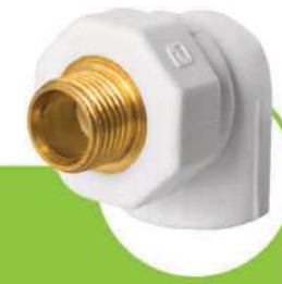
زانو یکسر مغزی فلزی ONE-END METAL CORE ELBOW