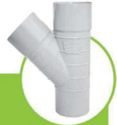
سراهی 45 درجه سایلنت TRIPLE-COUPLING TEE 45-DEGREE