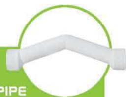
لوله خم‌دار دو سر پوش DOUBLE SOCKET BEND PIPE