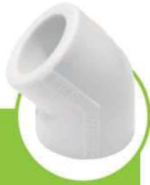
زانو ۴۵ درجه 45-DEGREE ELBOW