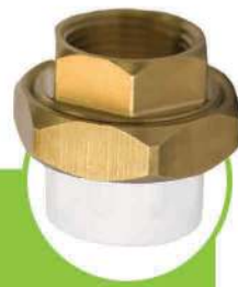
مهله ماسوره بوشن فلزی METAL COUPLING UNION