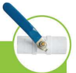
شیر مغزی برنجی BRASS BALL VALVE