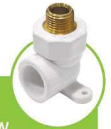
زانو مغزی فلزی دیواری WALL CORE METAL ELBOW