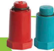
درپوش پایه بلند قرمز و آبی LONG CAP - RED & BLUE