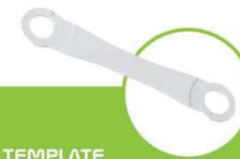
شابلون نصب INSTALLATION TEMPLATE