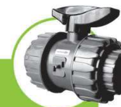
شیر توپی BALL VALVE