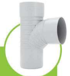
سراهی خم 87.5 درجه 87.5-DEGREE TEE