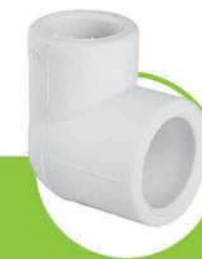
زانو تبدیل ۹۰ درجه 90-DEGREE REDUCING ELBOW