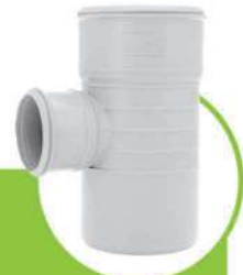
سراهی تبدیل 90 درجه سایلنت SILENT 90-DEGREE TEE CONVERSION JUNCTION