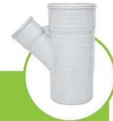
سراهی تبدیل 45 درجه سایلنت SILENT 45-DEGREE TEE CONVERSION JUNCTION