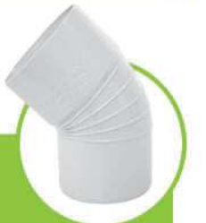
زانو 45 درجه سایلنت SILENT 45-DEGREE TEE