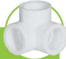
سراهی سه کنج CORNER TEE