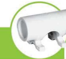
پل بست دار BRIDGE