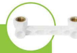
زانو بوشن فلزی زوج DOUBLE METAL COUPLING ELBOW