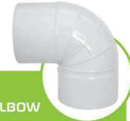
زانو 90 درجه سایلنت SILENT 90-DEGREE ELBOW