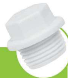
درپوش رزوه دارایه کوتاه SHORT SOCKET CAP