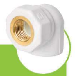
زانو یکسر بوشن فلزی ONE-END METAL COUPLING ELBOW