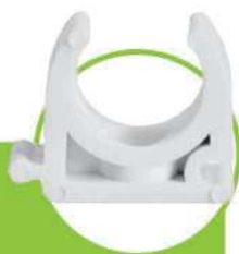
بست لوله PIPE CLAMP