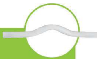
لوله خم دار BEND PIPE