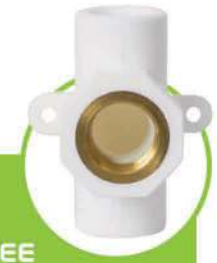
سراهی بوشن فلزی دیواری METAL COUPLING WALL TEE