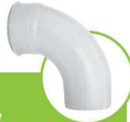
زانو خم 87.5 درجه 87.5-DEGREE ELBOW