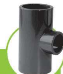
سراهی تبدیل ۹۰ درجه 90 DEGREE CONVERSION TEE